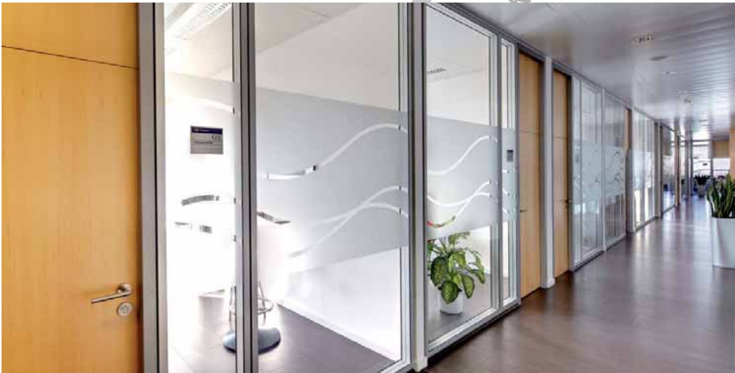
Galvaniho Business Center 4, Bratislava – Glastrennwand Lindner Life 125