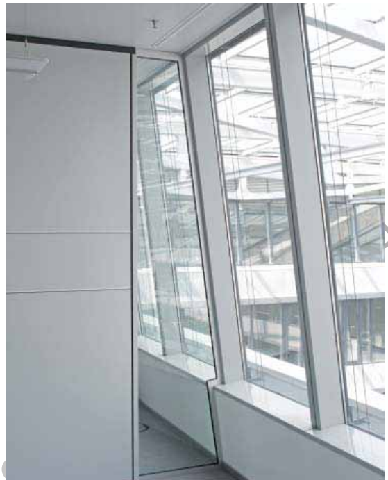
The Squire, Frankfurt – Lindner Plus Fassadenschwert

Akustikelemente ermöglichen in jedem modernen Bauwerk eine angenehme Raumakustik. Mit ihrer hohen schallabsorbierenden Wirkung ist eine geräuscharme Atmosphäre gewährleistet, für jeden das Richtige – in Größe, Perforation und Design.