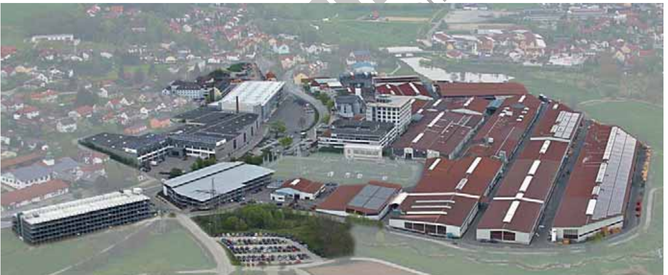
Lindner Wandsysteme fertigen wir auch an unserem Hauptsitz in Arnstorf

Alle damit verbundenen Leistungen bieten wir Ihnen aus einer Hand – einzeln oder als individuellen 360°-Betreuungskreislauf. So ermöglichen wir besonders effiziente Abläufe für die Realisierung auch ausgefallener Bauvorhaben.