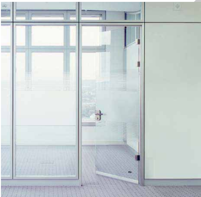
Barmenia, Wuppertal – Glastrennwand Lindner Life 125 mit Lindner Plus Ganzglastürblatt

Wie Sie Ihre Räume auch gestalten möchten: Bei uns finden Sie die passenden Zargen, beispielsweise aus Aluminium, Stahl und Holz.