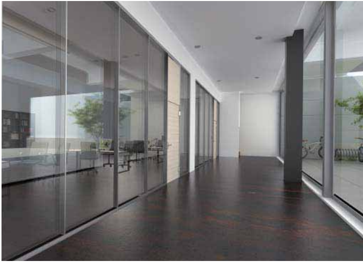
Glastrennwand Lindner Life 621