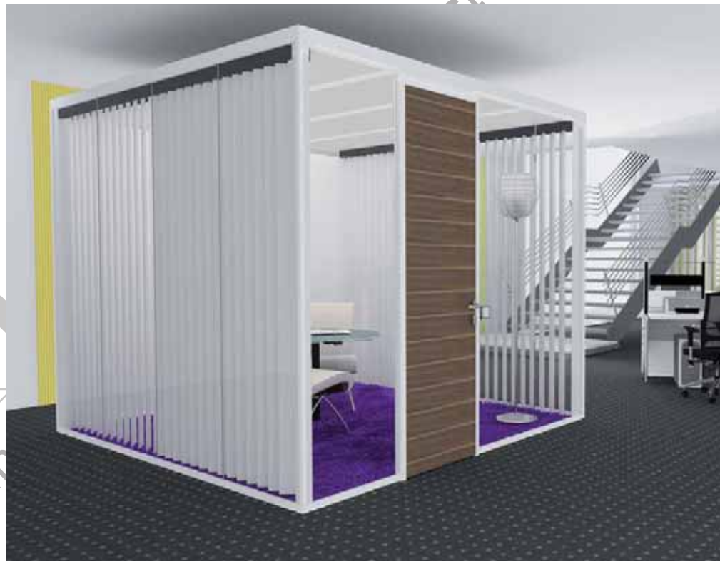
Raum-in-Raum System Lindner Cube

Lindner Cube ist der Rückzugsort, den Sie sich schon immer gewünscht haben. Und das genau an der Position, die Sie sich dafür aussuchen! Denn diese flexible Lösung benötigt keinen Anschluss an tragende Wände oder Decken: Der Lindner Cube bietet ein Höchstmaß an Anpassungsfähigkeit, da er sich vollkommen Ihren Anforderungen anpasst und nach dem Aufstellen jederzeit spielerisch im Raum versetzen lässt. Ob als Einfach- oder Doppelverglasung, als Metall- oder Holzvollwandkonstruktion – den Cube können Sie vielfältig konfigurieren und sich dadurch inmitten eines jeden Großraumbüros einen Ort der Ruhe, Konzentration und geistigen Produktivität schaffen.