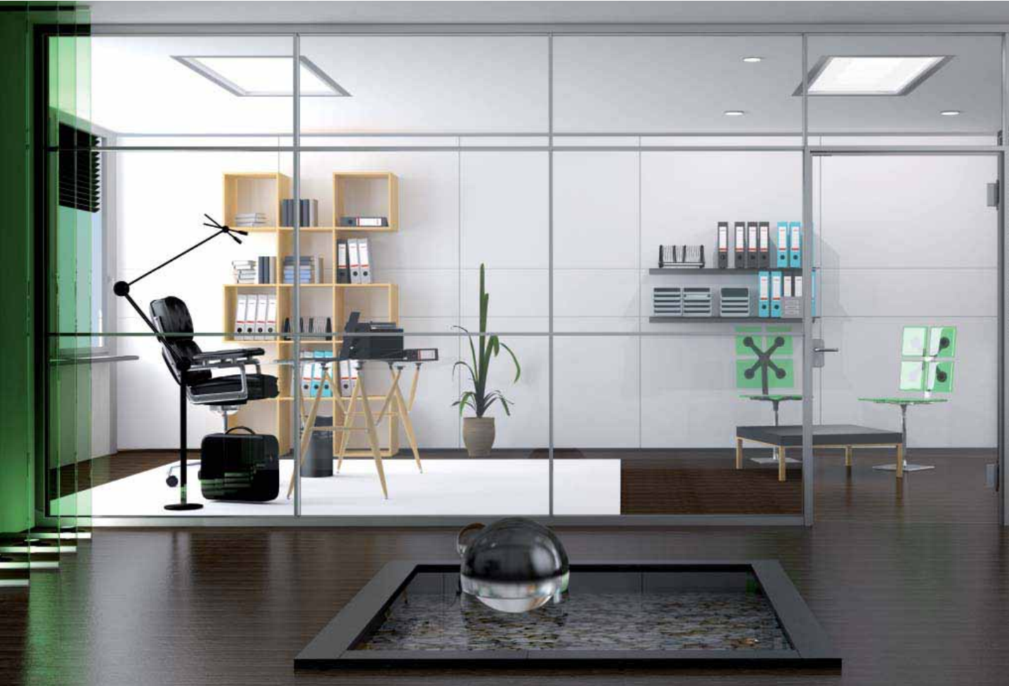
Glastrennwand Lindner Life 621