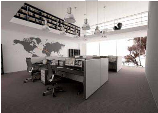
Trennwand Lindner Logic 680