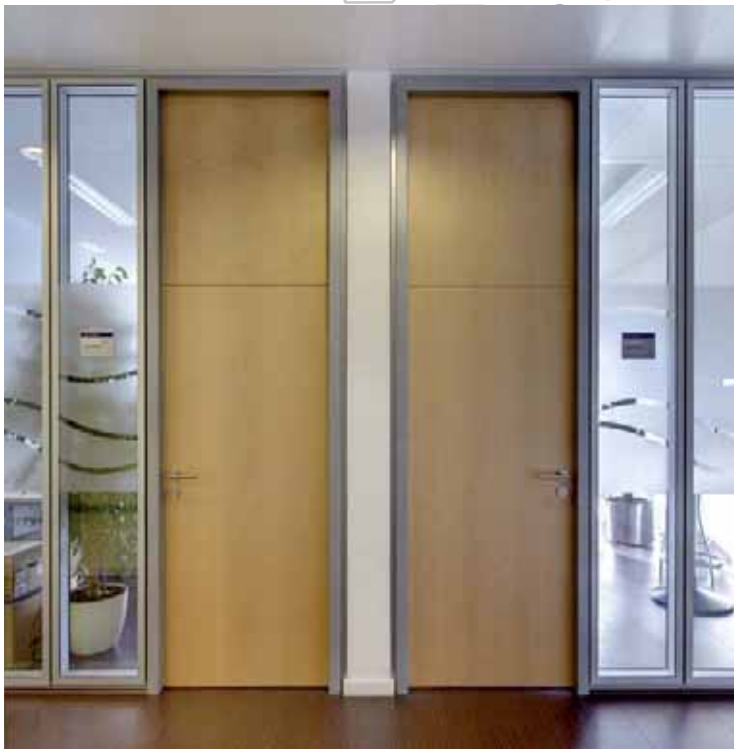
Galvaniho Business Center 4, Bratislava – Lindner Plus Aluminiumzarge

Mit unseren Zargen und Türblättern aus eigener Produktion können wir schnell und passgenau auf Ihre Bedürfnisse eingehen. Sie haben ein Spezialprojekt geplant? Darauf freuen wir uns sogar besonders: Jahrelange Erfahrung und die enge Zusammenarbeit mit allen Unternehmensbereichen ermöglichen es uns, auch ganz spezielle Wünsche zu erfüllen – zum Beispiel in Hinblick auf Brand-, Schall-, Einbruch- und Strahlenschutz.