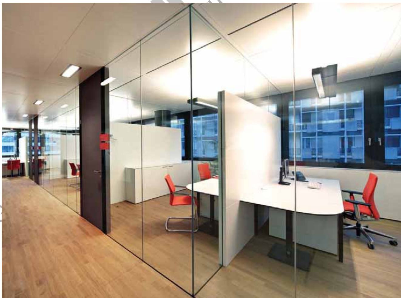
Handelskammer Bozen – Sonderkonstruktion Glastrennwand Lindner Life 620 mit vorgehängten Akustikelementen

Moderne Bürogebäude vereinen ausgereifte Funktionalität, größtmögliche Flexibilität, ein gesundes Raumklima und Energieeffizienz. Lindner Wandsysteme garantieren mit ihren vielfältigen Gestaltungs- und Kombinationsmöglichkeiten den maßgeschneiderten Einsatz in Räumen jeden Zuschnitts. Auch für die Handelskammer Bozen fanden wir die optimale Lösung: Die neu entwickelten Glastrennwände fluten den Innenraum mit Tageslicht und schaffen ein offenes kommunikatives Umfeld für alle Mitarbeiter. Gepaart mit hochwirksamen Akustikelementen entstand ein rundum stimmiges und hochwertiges Bürokonzept für die Zukunft.