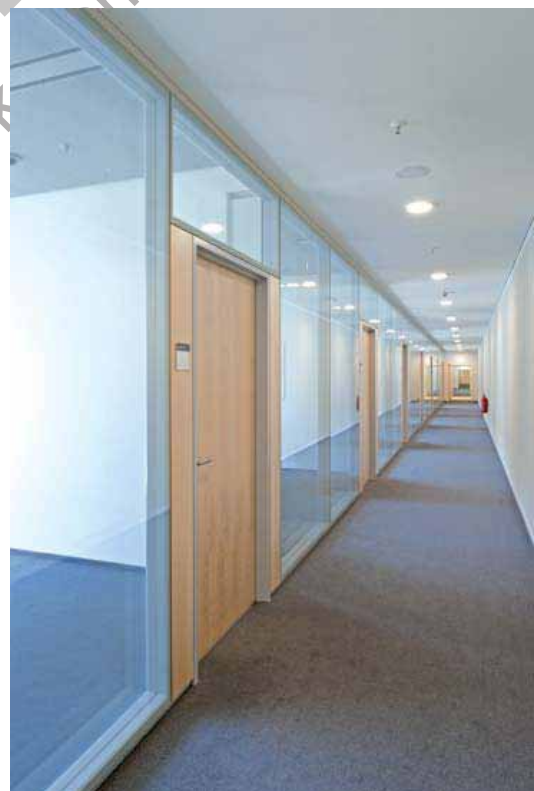
Bügelbauten, Hauptbahnhof Berlin – Glastrennwand Lindner Life 137

Bei allen Abläufen und Prozessen legen wir höchsten Wert auf umfassende Qualitätssicherung. So können wir Ihnen immer hervorragende Produkte und Leistungen bieten. Darüber hinaus zählen Arbeitssicherheit und Umweltschutz zu den wichtigsten Zielen unseres Unternehmens: Aus diesem Grund schließt unser integriertes Qualitätsmanagement automatisch alle ökologischen und Sicherheitsfragen mit ein. Unsere modernen Fertigungsanlagen sorgen für passgenaue Vorfertigung und eine lange Nutzungsdauer bei effizientem Rohstoffeinsatz und minimalem bauseitigen Abfall.