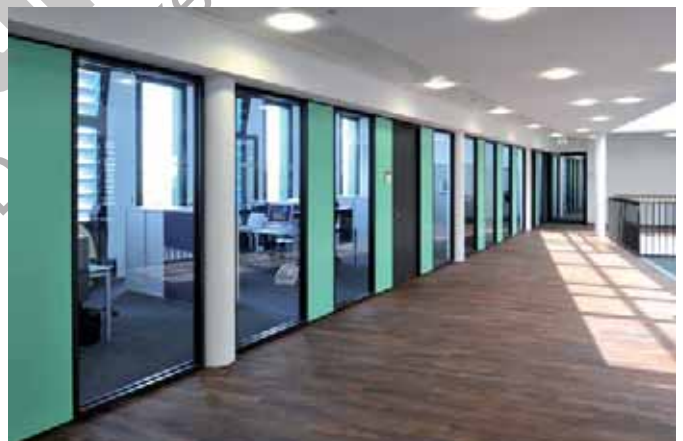
VGH Warmbüchenkamp – Glastrennwand Lindner Life 110

Sie möchten eine möglichst exklusive Wirkung erzielen? Entscheiden Sie sich einfach für Glastrennwände mit beidseitig eingehängten Aluminiumrahmen. Das Ergebnis überzeugt durch seine feingliedrige Ansichtsbreite. Sie können zwischen verschiedenen Oberflächenausführungen wählen – ganz nach Ihren Wünschen.