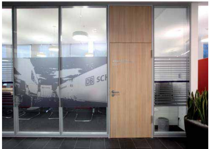
Schenker & CO AG, Wien – Glastrennwand Lindner Life 126