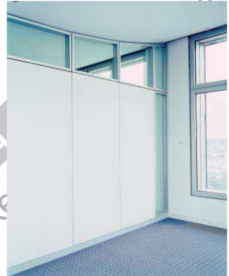
Barmenia, Wuppertal – Metalltrennwand Lindner Logic 100