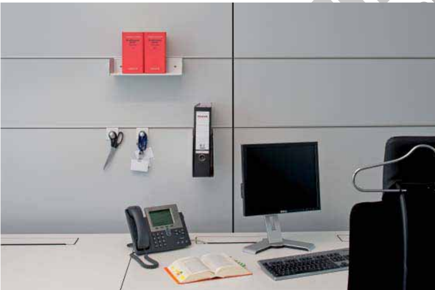
The Squire, Frankfurt – Lindner Plus Organisation

Mit unseren Organisationselementen, Ablage- und Einhängesystemen sind Bücher, Akten und Ordner immer am richtigen Platz. Notizen und Terminpläne ebenfalls, da die meisten Elemente mit pinnfähigen Materialien ausgestattet werden können.