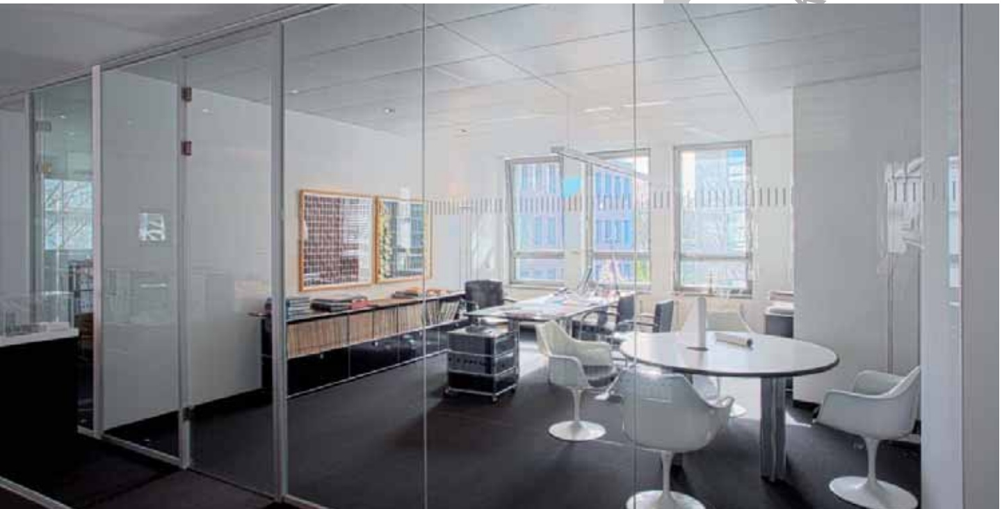
RKW Architekten, Düsseldorf – Glastrennwand Lindner Life 620