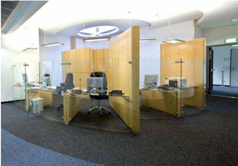
Deutschlandradio Köln – Holztrennwand Lindner Logic 100

Dank der außergewöhnlichen Vielfalt an eingesetzten Materialien und Paneelausführungen kann dabei so gut wie jedes Design verwirklicht werden. Auch auf Transparenz brauchen Sie nicht zu verzichten: Kombinieren Sie Ihre Wände einfach mit horizontal oder vertikal geteilten Verglasungen. Für mehr Raum und Ordnung sorgt die Lindner Logic zudem – mit passgenauen Regalträgern und Accessoires wird die Vollwand zum Organisationsprofi.